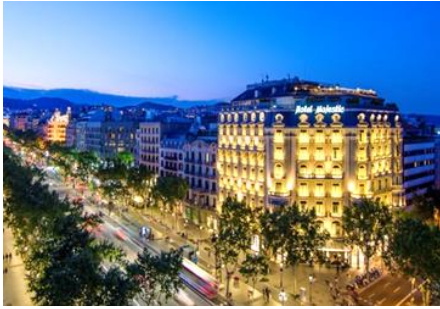
Hôtel Majestic – Barcelone