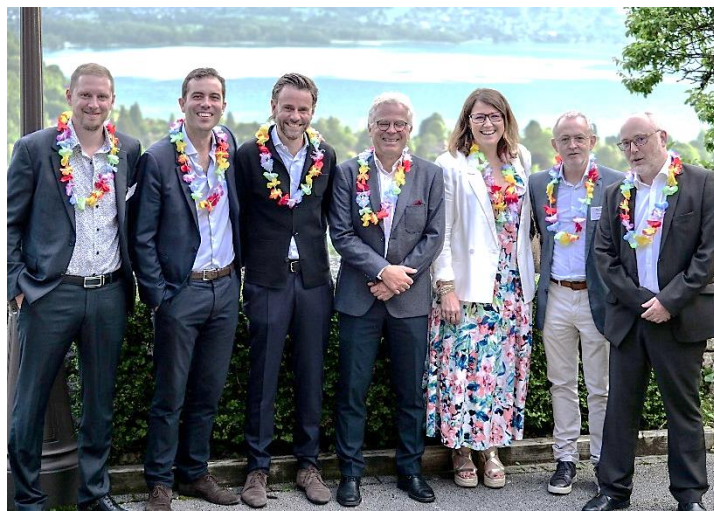
L'équipe ECOLAB, gagnante du Lake Safari Challenge.

Après une découverte parsemée d'énigmes sur le Lac, la soirée de gala se déroulait au château de Menthon, romantique évocation du château de la Belle au Bois dormant, offrant une vue plongeante sur tout le Lac d'Annecy.